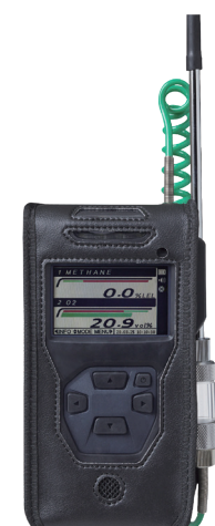
皮套 [C-37] 保护机器 免受污染和损伤。